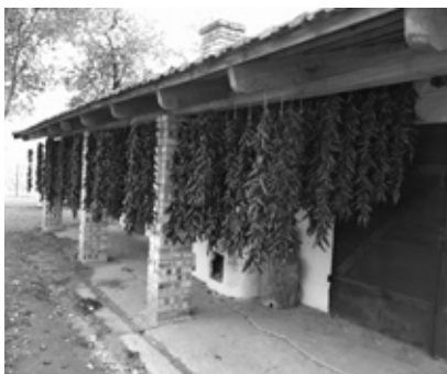
Szikkad a paprika Újszentgyörgyön is

A közfoglalkoztatásból származó bevételt vissza kell forgatni, az önkormányzat az ebből származó bevételt másra nem fordíthatja. A 2015. évi bevételből építettük