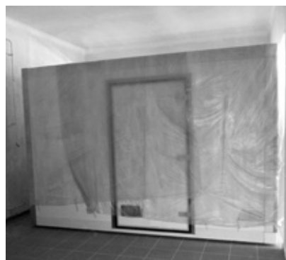
Megérkezett a szárító

A baromfi istálló melletti szociális blokk kialakításának munkálatai lassan befejeződnek, jelenleg a nyílászárók mázolása folyik.