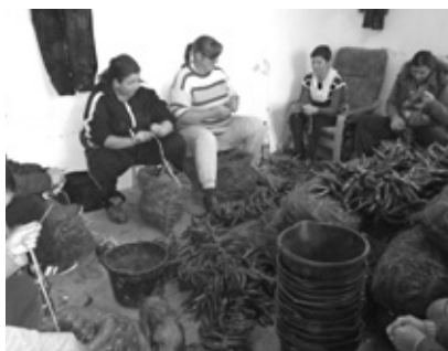
Szorgos kezek fűzik a paprikát Tiszaszentimrén és Újszentgyörgyön

a szociális blokkot, vásároltuk meg a takarmánykeverő daráló gépet, építettük a 2-ik bálatórozót, mely alkalmas a fűszerpaprika szikkasztására is.