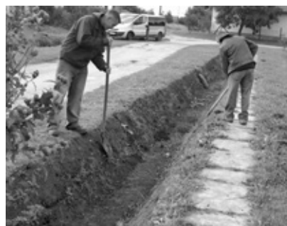
Újszentgyörgy, Szabadság út

Kátyúzást végzünk mindkét településen, összesen 5 km hosszon.